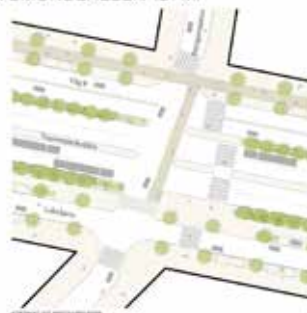
NYA TRAVEMÜNDEALLÉN (57M)

Förslag till utformning av gaturum, Gemensam utredning om västlig infart, Spacescape (2019)