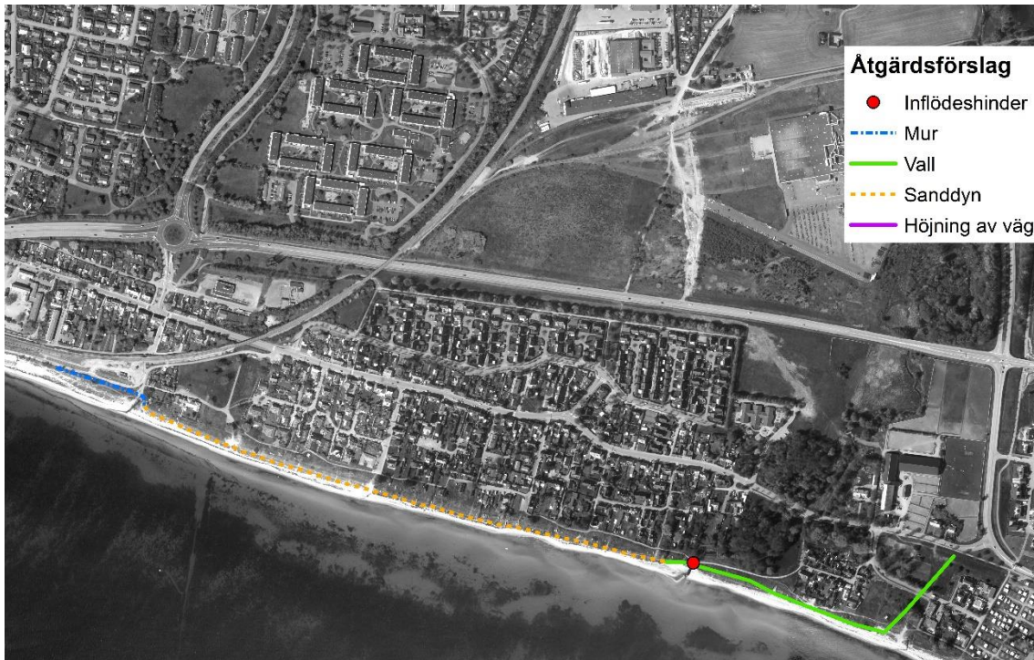
Figur 2 Alternativt åtgärdsförslag för skydd av bebyggelsen i Östra stranden

För Östra stranden föreslås en alternativ sträckning för översvämningvallen, denna visas i Figur 2. Istället för att löpa längs Dalköpingeåns västra sida anläggs vallen istället över åns utlopp, för att på så sätt även skydda delar av bebyggelsen i Dalköpinge. Åtgärdsförslaget är beroende av ett inströmningshinder så som en lucka eller en sluss installeras vid åns utlopp, och att vatten kan omhändertaras under de perioder inströmningshindret är stängt.