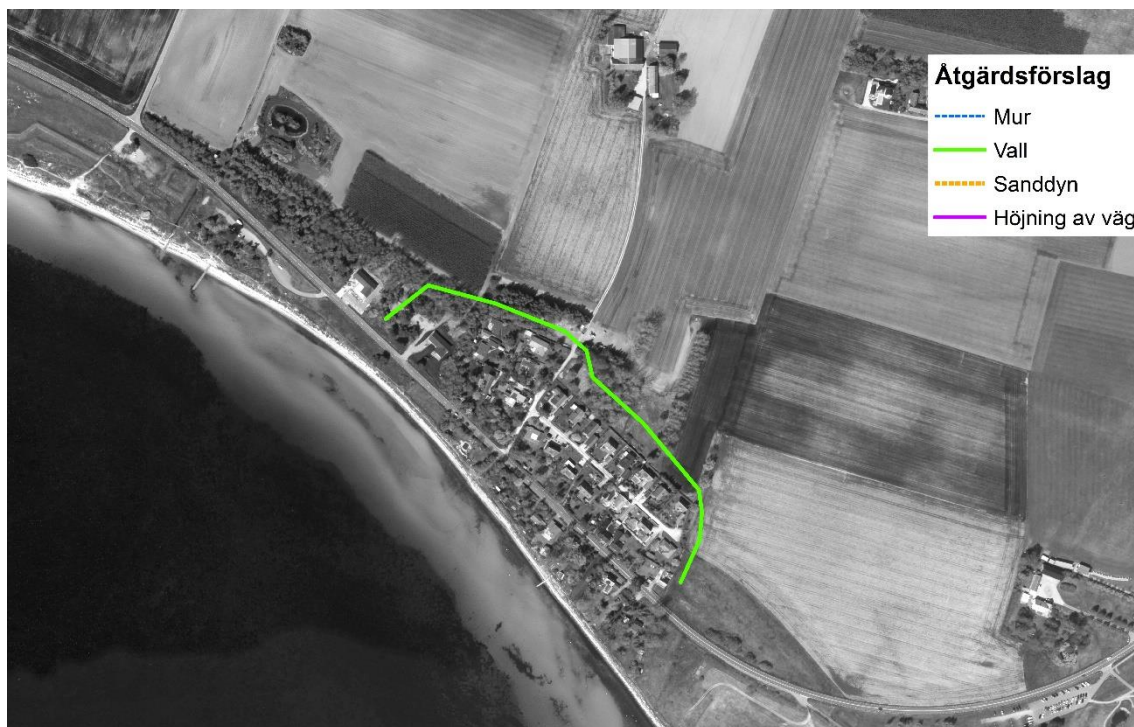
Figur 1 Alternativt åtgärdsförslag för skydd av bebyggelsen i Tivolihusen.

Det alternativa åtgärdsförslaget för Tivolihusen är att anlägga en vall i åkermarken norr om bebyggelsen, se Figur 1. Åtgärdsförslaget förhindrar vatten från att översvämma området norrifrån.